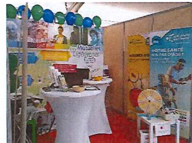
Stand Foire de Challans